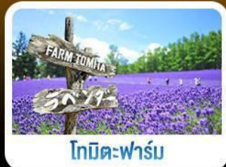
โทมิตะฟาร์ม