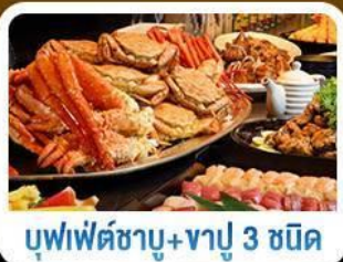
บุฟเฟ่ต์ซาบุมุ+ชาปู 3 ชนิด