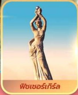
พีชเซอร์เกิร์ล