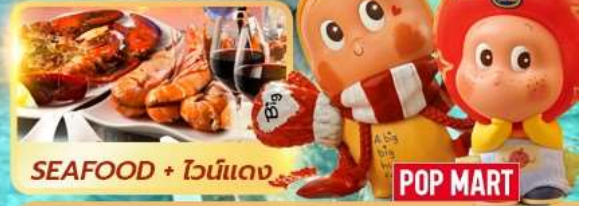
SEAFOOD + ไวน์แดง