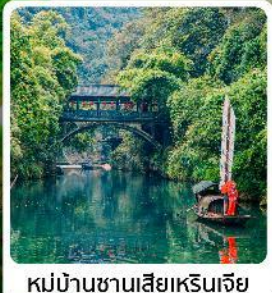
หมู่บ้านซานเสี่ยเหรินเจีย