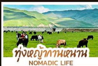
ทุ่งหญ้ากานหนาน NOMADIC LIFE