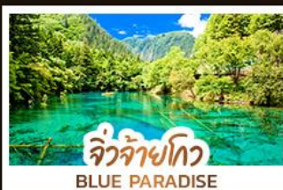
จิวจ้ายโกว BLUE PARADISE