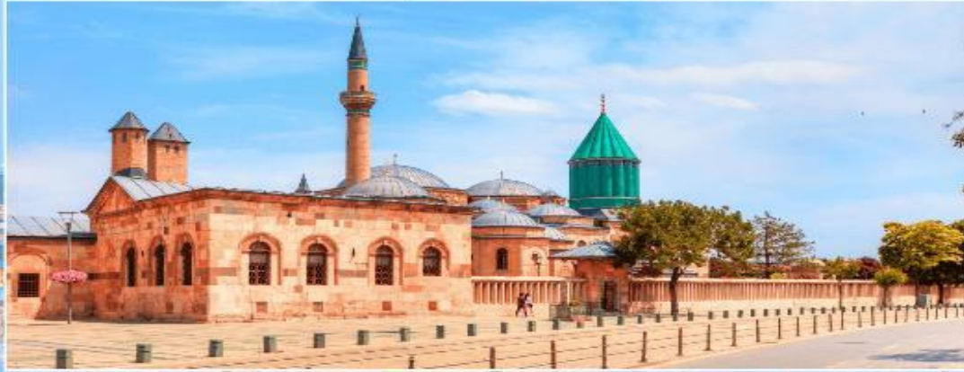
พิพิธภัณฑ์เมฟลานา KONYA

เดินทางสู่ เมืองปามุกคาล่ (PAMUKKALE) แปลว่า ปราสาทพุยฝ้าย อยู่ในเมืองชื่อเดียวกัน จังหวัดเดนิซลี ประเทศตุรเคีย เป็นเนินเขาหินปูนสีขาว มีความยาวประมาณ 2.7 กิโลเมตร สูง 160 เมตร เกิดจากน้ำพุร้อนที่นำแคลเซียมคาร์บอเนตมาตกตะกอน ปามุกคาล่ ได้รับการขึ้นทะเบียนเป็นแหล่งมรดกโลกร่วมกับฮีเอราโปลิสซึ่งเป็นเมืองโบราณที่ตั้งอยู่บนปามุกคาล่ ใน พ.ศ. 2531 (ใช้เวลาเดินทางประมาณ 5 ชั่วโมง)