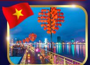
สะพานแห่งความรัก ดานัง