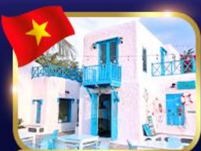
คาเฟ่สไตล์ซานโตรินี่ ชันตรา มาริน่า