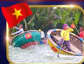
ล่องเรือกระดิว หมู่บ้านกัมบาน