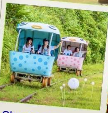
Shen'ao Rail Bike