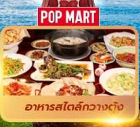
อาหารสไตล์กวางตุ้ง