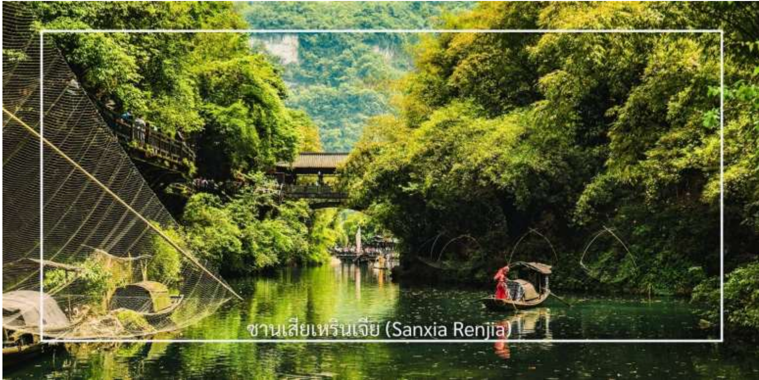
ซานเซียเหรินเจีย (Sanxia Renjia)

นำท่านสู่ หมู่บ้านซานเซียเหรินเจีย (Sanxia Renjia) (รวมล่องเรือ) สถานที่นี้เป็นที่รู้จักกันในชื่อ หมู่บ้านสามผา แหล่งท่องเที่ยวระดับ 5A ตั้งอยู่ในเขตหุบเขาสามผา ริมน้ำแยงซีเกียง โดดเด่นด้วยทัศนียภาพทางธรรมชาติอันงดงามของภูเขาหินผา สายน้ำ และหุบเขาที่โอบล้อมกันอย่างกลมกลืน สถานที่แห่งนี้สะท้อนวิถีชีวิตดั้งเดิมของชาวลุ่มแม่น้ำแยงซีเกียง ผ่านสถาปัตยกรรมพื้นบ้าน วัฒนธรรม ประเพณี ที่ยังคงเอกลักษณ์ไว้อย่างครบถ้วน พร้อมให้ท่านได้ชมการแสดงเรื่องราวเกี่ยวกับวิถีชีวิตควบคู่กับสายน้ำ