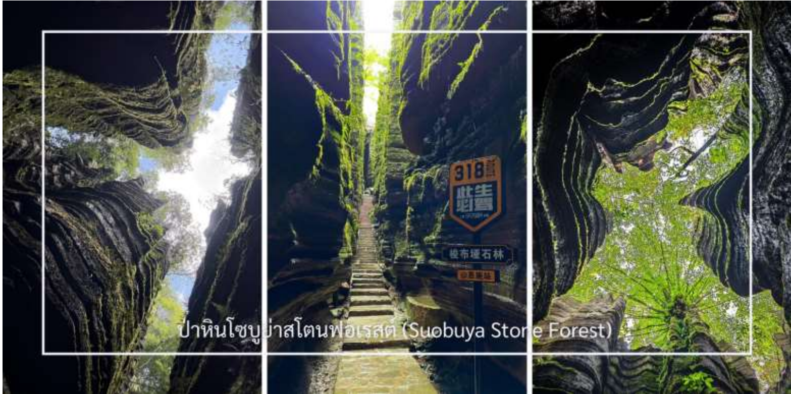
ป่าหินโซบูย่าสโตนฟอเรสต์ (Suobuya Stone Forest)

หลังอาหารเช้าให้นำท่านสู่ ป่าหินโซบูย่าสโตนฟอเรสต์ (Suobuya Stone Forest) แหล่งท่องเที่ยวทางธรรมชาติอันน่ามหัศจรรย์ ซึ่งโดดเด่นด้วยกลุ่มหินปูนรูปร่างแปลกตาที่ก่อตัวขึ้นตามธรรมชาติเป็นเวลานับล้านปี ภายในพื้นที่เต็มไปด้วยเสาหินสูงตระหง่านเรียงรายสลับซับซ้อน เปรียบเสมือนป่าที่สร้างขึ้นจากหิน ผสานกับบรรยากาศร่มรื่นและเงียบสงบ เหมาะแก่การเดินชมธรรมชาติและเก็บภาพความประทับใจตลอดเส้นทาง