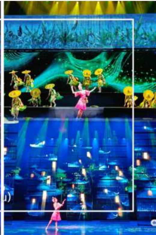
การแสดงโชว์ซีลิ่งคาปู (Xilan Kapu)

เดินทางเข้าโรงแรมที่พัก Xiazhou Hotel ระดับ 4 ดาวหรือเทียบเท่า