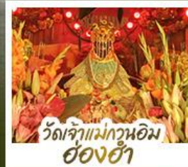
ว้ดเจ้าแม่กวนอิมอ่องฮ้่า