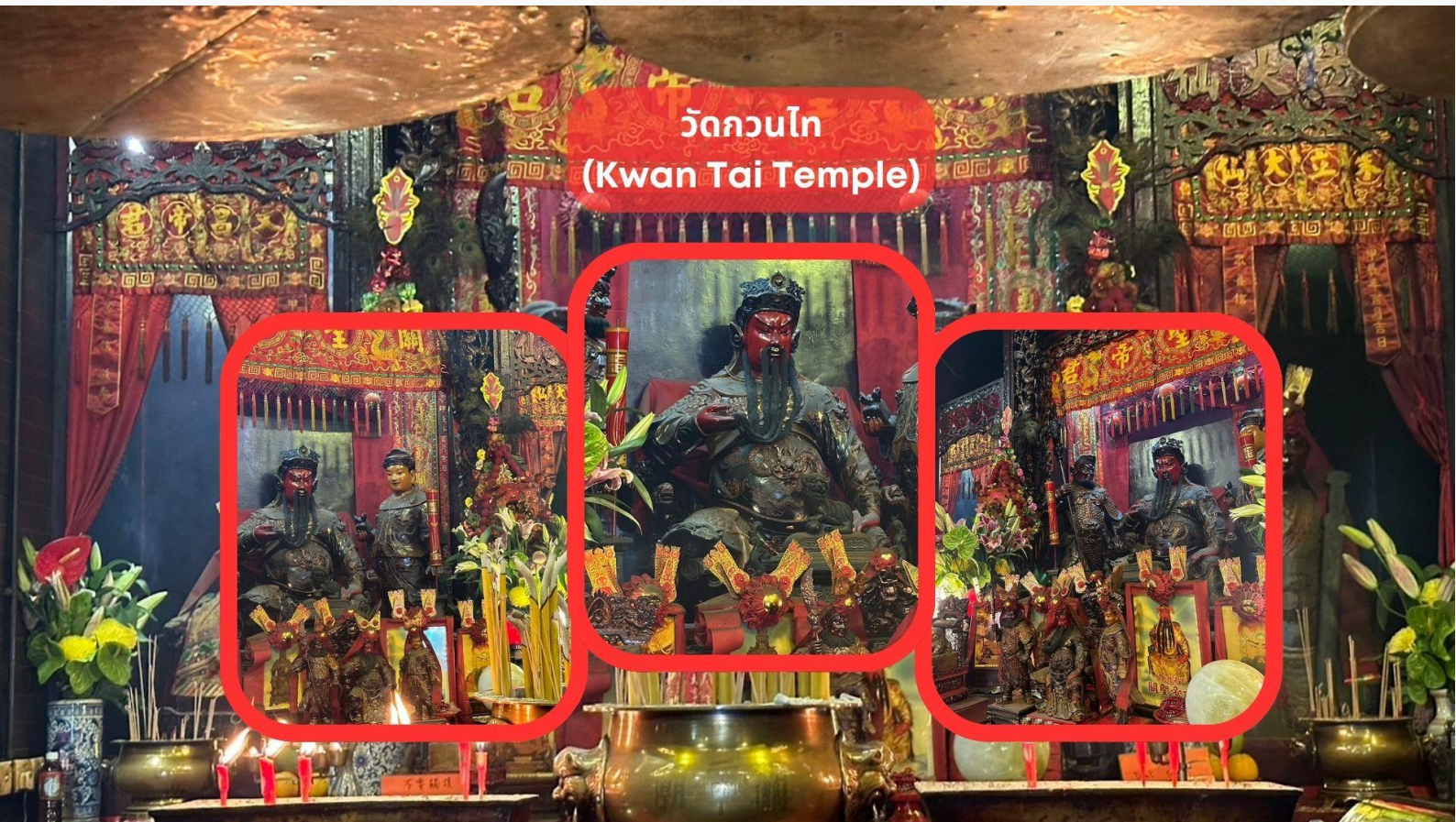
วัดกวนไท (Kwan Tai Temple)

รับประทานอาหารเช้า ณ ภัตตาคาร บริการท่านด้วยเมนูติ่มซำฮ่องกง (มื้อที่ 2)