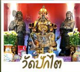
ว้ดป้กไต่