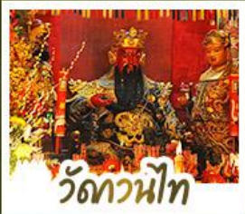
ว้ดกวนน้ีท