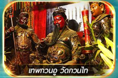
เทพกวนอู วัดกวนไท

พามุไหว้พระ: ขอรพร 8 วัดดัง, อีสร: ช้อปปิ้ง 1 วันเต็มแบบจุใจ