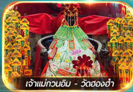
เจ้าแม่กวนอิม - วัดสองฮา