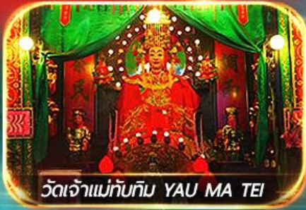
วัดเจ้าแม่ทับทิม YAU MA TEI