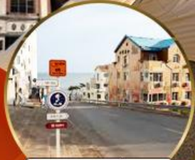
ถนนอ่าวจวีป่า