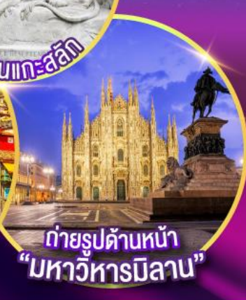
ถ่ายรูปด้านหน้า "มหาวิหารมิลาน"