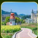
สวน Alice's Garden