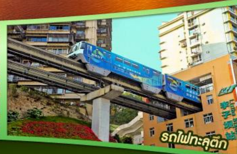
รถไฟฟ้าลัด