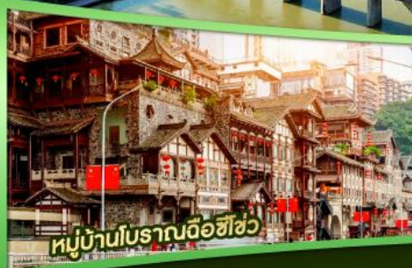
หมู่บ้านโบราณฉือฮิว

ไปเที่ยวฮิลลี่ ฉงชิ่ง 5 วัน 4 คืน เฉียนเจียง อุ่หลง