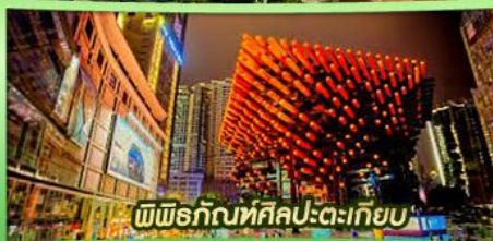
พิพิธภัณฑ์ศิลปะตะเกียบ