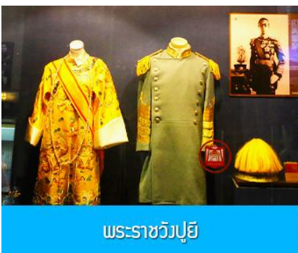
พระราชวังปู้ยี้

เช้า รับประทานอาหารเช้า ณ ห้องอาหารของโรงแรม (7)