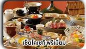
เซตโคเชกิ พรีเมียม