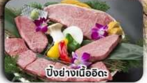
บั้งย่างเนื้ออึด