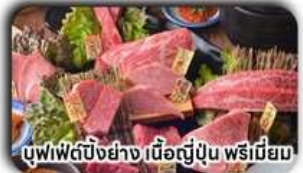
บุฟเฟ่ต์บั้งย่าง เนื้อญี่ปุ่น พรีเมียม