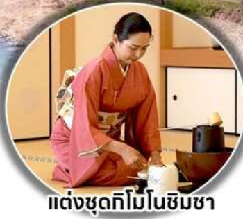
แต่งชุดกิโมโนชิมชา