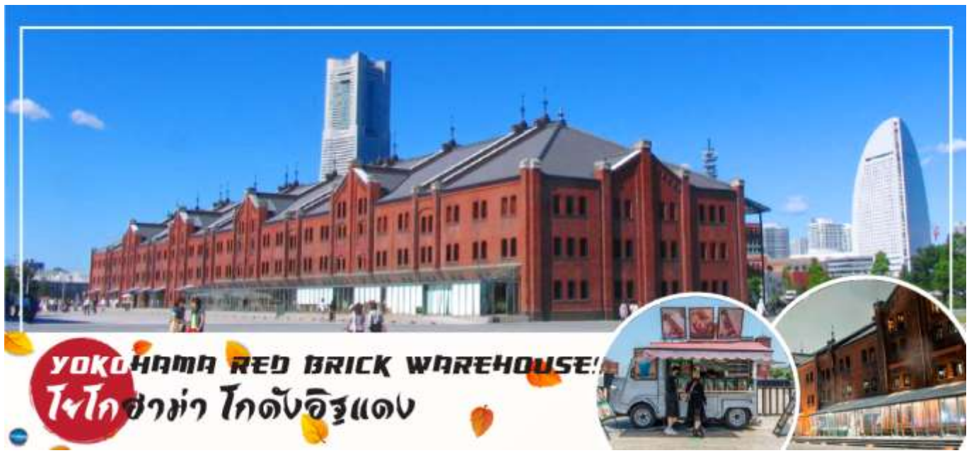
YOKOHAMA RED BRICK WAREHOUSE! โยโกฮาม่า โกดังอิฐแดง

วันที่สอง ท่าอากาศยานนานาชาตินาริตะ – เมืองโยโกฮามะ – โกดังอิฐแดง – จุดชมวิวสวนอาคารเระะ – MITSUI OUTLET PARK YOKOHAMA BAYSIDE – จังหวัดยามานาชิ – ออนเซ็น