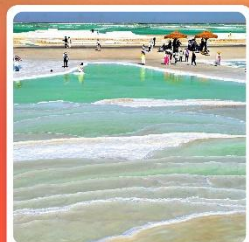
ทะเลสาบเกลือจาเอ้อหนาน