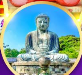
วัดโคโคคุอิน