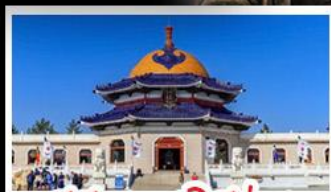
สุสานเจกิสข่าน