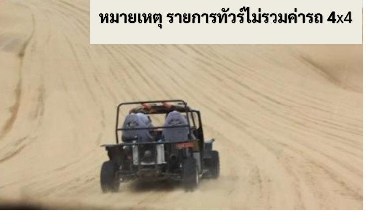
หมายเหตุ รายการทัวร์ไม่รวมค่ารถ 4x4

กลางวัน รับประทานอาหารกลางวัน ณ ภัตตาคาร (เมื่อที่ 8)