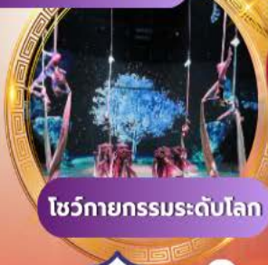
โชว์กายกรรมระดับโลก