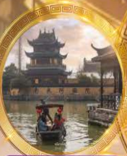
หมู่บ้านโบราณจู่เจียเจี้ยว

บินหรู Full service พัก 5 ดาวย่านช้อปปิ้ง