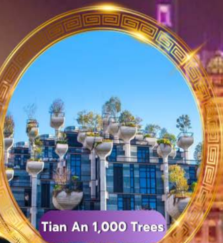
Tian An 1,000 Trees