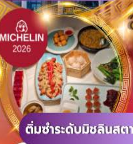
ติมชำระระดับมิชลินสตาร์

สัมผัสทัศนียภาพเซี่ยงไฮ้ เช็กอินแลนด์มาร์คล้ำยุค ล่องเรือเมืองเก่าจู่เจียเจี้ยว พักหรู 5 ดาว ครบจบในทริปเดียว