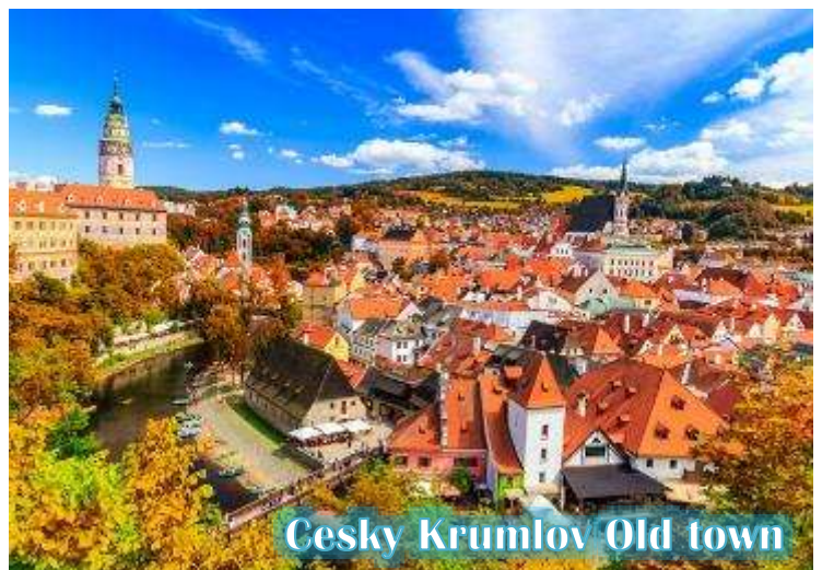
Cesky Krumlov Old town

บ่าย นำท่านเดินทางสู่ “เมืองเชสกี้ คุมลอฟ (เมืองมรดกโลก)” เป็นเมืองขนาดเล็กในภูมิภาคโบฮีเมียใต้ของ สาธารณรัฐเช็กมีชื่อเสียงจากสถาปัตยกรรม และศิลปะของเขตเมืองเก่าและปราสาทคุม ลอฟ ที่ยังคงมีเสน่ห์เหมือนอยู่ในเทพนิยายมา จนถึงทุกวันนี้ และน่าจะเป็นเมืองที่สวยงามที่สุดใน สาธารณรัฐเช็ก, เชสกี้ คุมลอฟได้รับการจัด อันดับให้อยู่ในสิบเมืองที่สวยงามที่สุดในโลก เป็น หนึ่งในสถานที่ที่สวยงามที่สุดและไม่ควรพลาด ในการเดินทางไปสาธารณรัฐเช็ก เดินเล่นไปบน ถนนในยุคกลาง ปราสาทสไตล์บาโรกที่ไม่บุบ สลาย และแม่น้ำที่คดเคี้ยว เมืองเก่าที่งดงามแห่งนี้ได้รับการอนุรักษ์ไว้อย่างดีจากอดีตและการทิ้งระเบิดใน สงครามโลกครั้งที่ 2 ทั้งหมดทำให้เมืองที่มีทิวทัศน์แห่งนี้รู้สึกเหมือนอยู่ในเทพนิยายจากยุคกลางสู่ความเป็นจริง