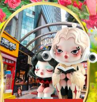
POP MART ถนนคนเดินหนานผิงเจีย