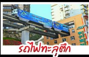
รถไฟทะลุติ๊ก