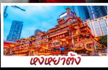
เจงเฉาตัง