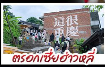
ตรอกเซี่ยฮ่าวหลี่