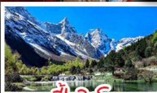
ปี่ผิงโกว