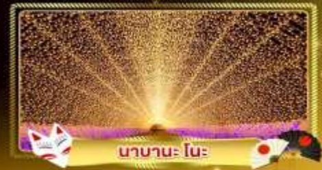
นานาโนะ โนะ