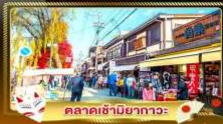
ตลาดซามิยากาวะ