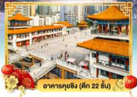
อาคารคยชิง (ตึก 22 ชั้น)