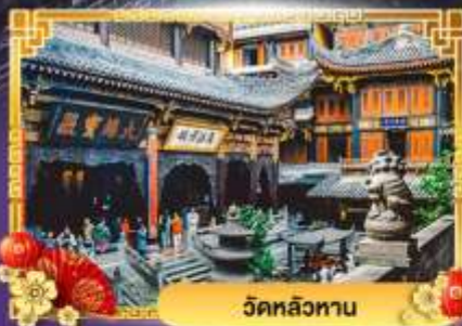
วัดหลิวทาน