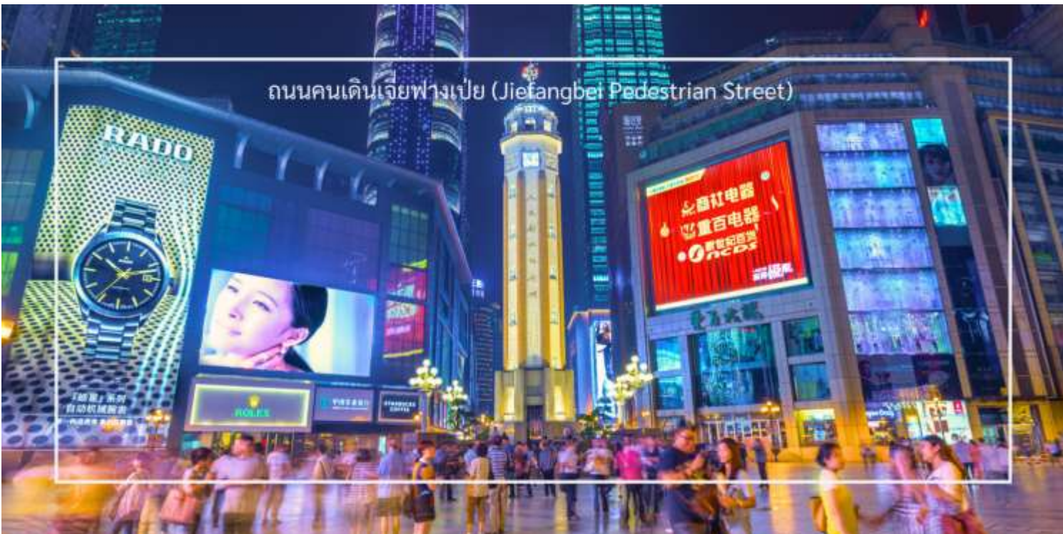
ถนนคนเดินเจี๋ยฟางเป่ย์ (Jiefangbei Pedestrian Street)

เครื่องประดับ และของที่ระลึก ท่านสามารถ แวะช้อปปิ้งร้านดัง “POPMART” ร้านดังจากจีน ที่รวมฟิกเกอร์ดีไซน์เก๋และตุ๊กตาน่ารักหลากหลายซีรีส์ยอดนิยม เช่น Molly, Dimoo, Labubu และอีกมากมาย ที่สายสะสมของเล่นไม่ควรพลาด เย็น อีศระอาหารเย็นให้ท่านรับประทานอาหารตามอัธยาศัย