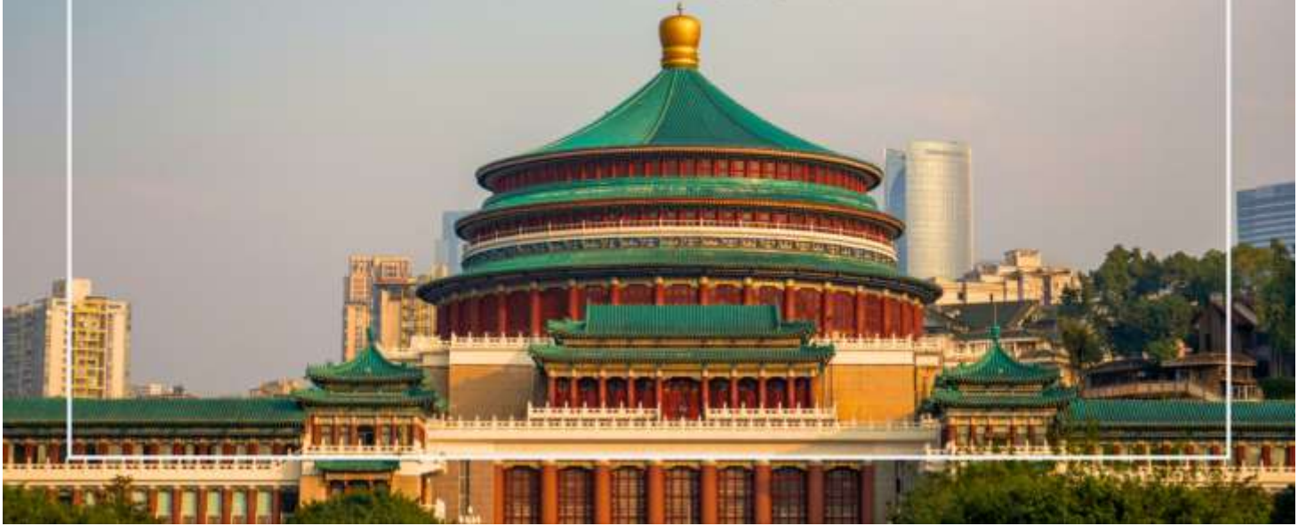
มหาศาลาประชาชนแห่งเมืองฉงชิ่ง (Chongqing People's Grand Hall)

เที่ยง บริการอาหารเที่ยง ณ ภัตตาคาร (มื้อที่ 7) เมนูพิเศษ : สุกี้หม่าล่า