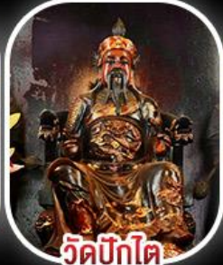
วัดบิกิต