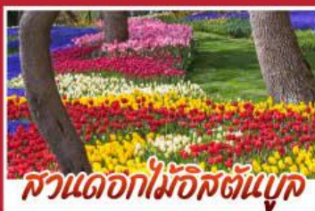
สวนดอกไม้อิสตันบูล