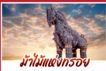
ม้าไม้แห่งกรวย