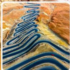
ถนนผานหลงกู่ต้าอว