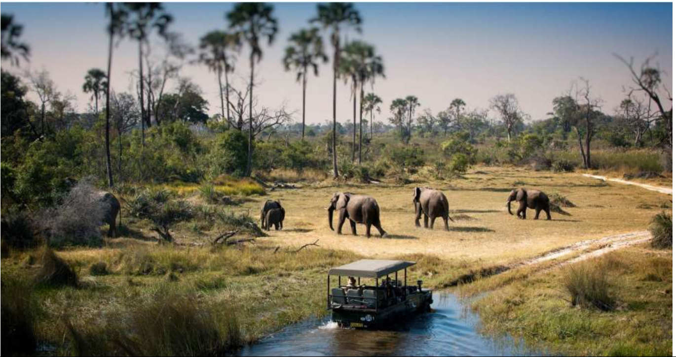
วันหยุดที่ดีที่สุดที่ 6 สิงหาคม 2569 Chobe National Park Botswana - Zambezi Sundowner cruise