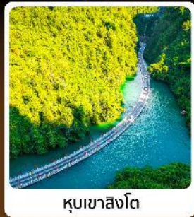
คุบเขาสิงโต

ไฮไลท์! ปืนตรงลงเอนชอ ที่ยวเอนชอนั้นๆจัดทีมทั่วเมือง คุบเขาสิงโต ผิงชานแกรนด์แคนยอน อุกยานจีนลู่ชาน