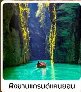
ผิงชานแกรนด์แคนยอน