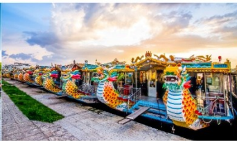
ล่องเรือมังกร