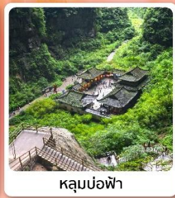
หลุมบ่อฟ้า