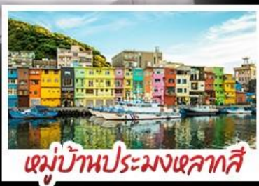
หมู่บ้านประมงเหลากาสี