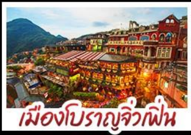
เมืองโบราณจีวเฟิน

เที่ยวธรรมชาติระดับโลก เอเชียตะวันออก ทะเลสาบสุริยันจันทรา - เมืองดงครบ ไทเป จีวเฟิน - ซีเหมินติง