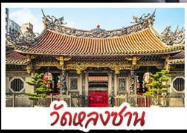
วัดเจหลงซาน