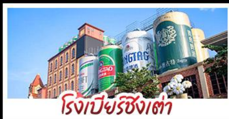
โรงเบียร์ซิงเต่า