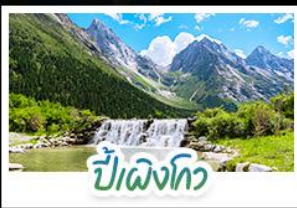
ปี้เฉิงโกว