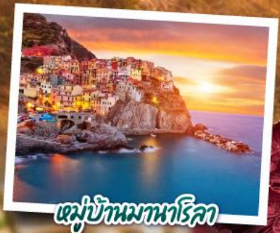
หมู่บ้านมานาโรคา