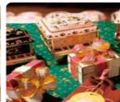
กล่องดนตรี MUSIC BOX