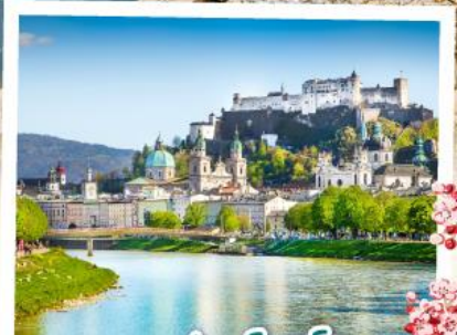
ซาลซ์บวร์ก