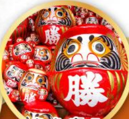
วัดคัตสึโอะอิ (วัดदारุมะ)

ชมความงามของกำแพงหิมะ เส้นทางสายอัลไพน์ทาเกยาม่า (JAPAN ALPS SNOW WALL)