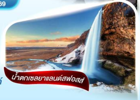
น้ำตกเซลยาแลนด์สฟอสส์