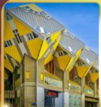
บ้านลูกเต่า โลกคู่บารมี

“ล่องเรือหลังคากระจก” ชมกรุงอัมสเตอร์ดัม