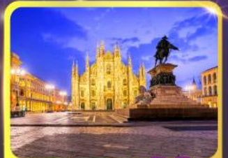
มหาวิหารคูโอโม