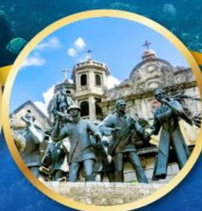
อนุสาวรีย์มรดกแห่งเซบู