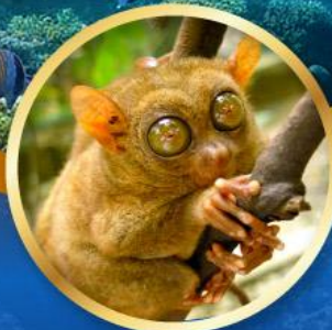
ลิงทาร์เซีย