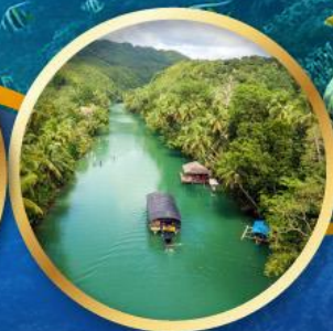
ล่องเรือแม่น้ำโลบ็อก