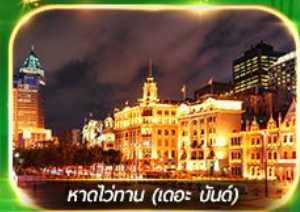
หาดไข่มุก (เดอะ บันด์)

เที่ยวมหานครเซี่ยงไฮ้ ถ่ายรูปเช็กอินที่ Tian An 1000 Trees, ซินเทียนตี้ ช้อปปิ้งตลาดเงินหวงเหมียว, ถนนนานกิง