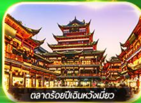
ตลาดร้อยปีเงินหวงเหมียว