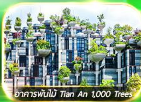
อาคารพันไม้ Tian An 1,000 Trees