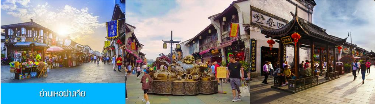
ย่านเหอฝางเจีย