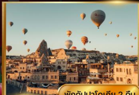
พิกัดบปาดเกีย 2 คืน