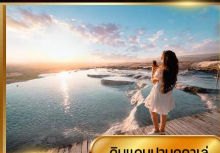
ดินแดนปามุคคาเล่