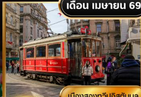
เมืองสองทวีปอิสตันบูล