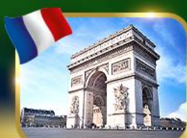
ประตูชัยฝรั่งเศส ปารีส