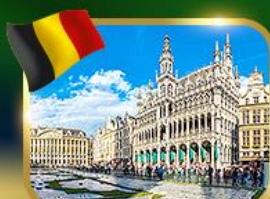
จัตุรัสกรอนด์ ปลาซ บริซเซลส์