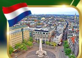
จัตุรัสดีนสแควร์ อัมสเตอร์ดัม