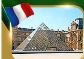
พีระมิดที่ลูฟวร์ ปารีส