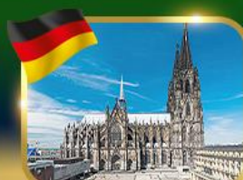
มหาวิหารแห่งเมืองโคโลญ